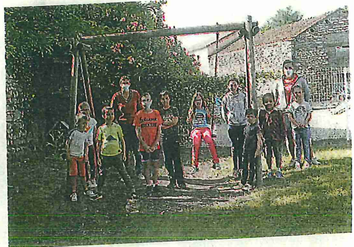
Les enfants heureux de se retrouver dans le respect du protocole.

> Des pré-inscriptions sont cependant obligatoires soit en téléphonant au 04 66 85 61 21