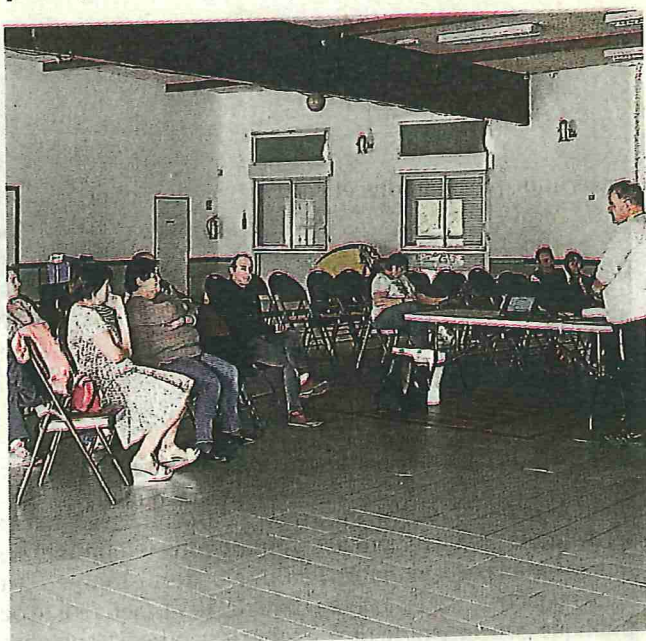
Comme l'an dernier, ateliers et café débat animeront la semaine.

Le centre socioculturel prépare la Semaine bleue