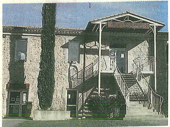
Les lieux publics réorganisent leurs services

Son fonctionnement sera expliqué sur la page Facebook de la médiathèque (mediathequedesalindres). Par ailleurs, la boîte de retour pour les prêts