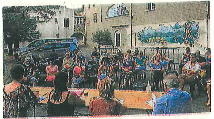
L'assemblée générale en juin s'est déroulée en extérieur..

Et bien d'autres activités encore : aide aux vacances, ateliers informatiques, aide aux démarches