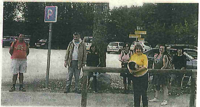
Une balade d'après confinement apprécié par tous les participants.

Le mois de juillet sera également actif car, en collaboration avec le secteur adultes/familles du Kiosque de Saint-Julien-les-Rosiers, Mélanie conviera les parents et leurs enfants, les personnes seules et les aînés, à des activités en pleine nature (ouvertes à tous).