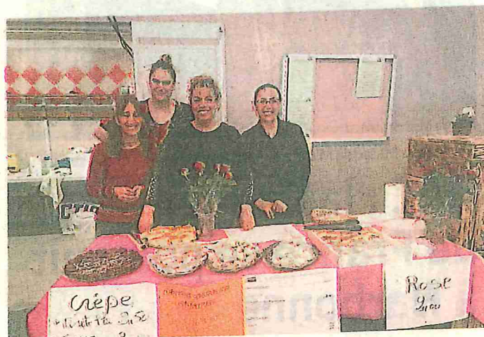
Les familles ont mis en place diverses actions.

« Durant six à dix mois, elles ont participé à des ateliers afin qu'elles assimilent les étapes de construction d'un projet vacances pour répondre à leurs interrogations du type "A quoi faut-il penser en termes de postes de dépenses ?" Et aussi "Comment rechercher et choisir sa destination et comment financer son séjour ?" Les participants ont ensuite organisé une action d'auto financement pour compléter leur budget vacances en proposant en février une vente de roses et de gâteaux lors du Salon des arts de Salindres. Aux bénéfices réalisés s'est ajoutée une épargne bonifiée et réelle mise en place