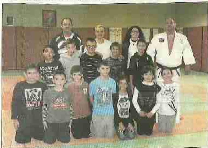
■ Quelques-uns des élèves de Marcel-Pagnol à une séance des Taps.

Corres. ML : 04 66 85 60 52 + midilibro.fr