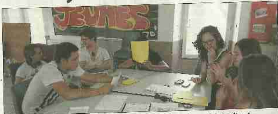
■ Derniers préparatifs avant le départ pour les jeunes du centre social et culturel.

Les huit jeunes salindrois âgés de 16 ans, préparent ce voyage depuis plusieurs semaines (choix des lieux, des moyens de transports, de l'hébergement, etc.). Le programme est orienté