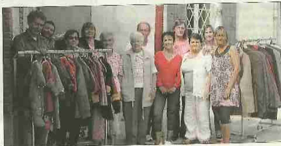
■ L'équipe des bénévoles du vestiaire de la boutique solidaire.

Ouvert à tous depuis février il enregistre une fréquentation en hausse constante : « Nous sommes vraiment satisfaits de constater de voir que cela évolue dans le bon sens et que les Salindrois, et même