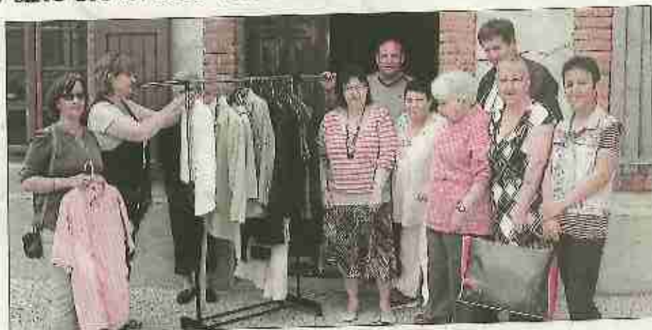
■ Les bénévoles vous souhaitent la bienvenue dans leur nouvel espace.

Les responsables du centre social et culturel ont annoncé lors de l'assemblée générale que, pour cause de budget en baisse, la destination initiale de l'Épicerie solidaire, à savoir apporter une aide alimentaire aux familles, disparaîtra à plus ou moins courte échéance. Ce terminus ne sera pas pour autant synonyme de fermeture puisque le lieu sera consacré à la mise en place de projets et d'actions où les bénévoles mettront en commun leur envie de partage et leur savoir-faire. C'est dans cette optique que depuis début avril, les lundis et les vendredis de 14h à 17 heures, tous se retrouvent au local pour accueillir le public désireux de passer avec eux des moments conviviaux. Ainsi, au fil du temps, cette proximité a permis de libérer la parole et un petit groupe s'est formé pour créer une activité où chacun prend plaisir à s'investir pour offrir une nouvelle vie aux vêtements. Lesquels, dans un premier temps, ont été récupérés via le bouche à oreille et minutieusement triés. « Mais aujourd'hui nous aimerions franchir une nouvelle étape. Nous comptons sur les Salindrois et les habitants des communes voisines pour approvisionner notre stock car un coin a été aménagé pour la vente des vêtements totalement contrôlés et à l'état irréprochable, cer-