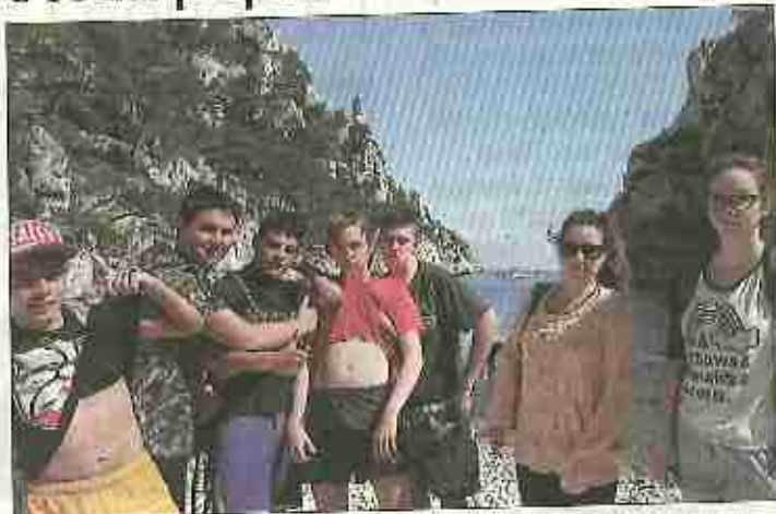
■ Après la visite des calanques de Cassis, les jeunes pensent à l'été.

Une autre tranche d'âge, les 14-17 ans, sera également en