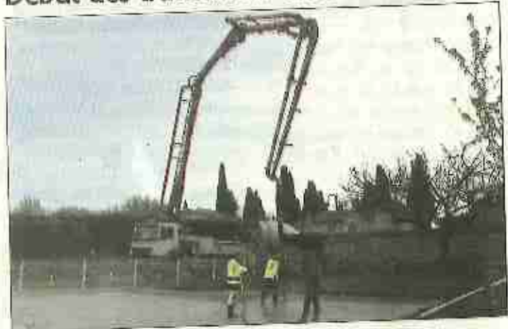
■ Le béton fibre acier a été coulé, vendredi, sur le chantier.

Depuis de nombreuses années, le centre de loisirs sans hébergement, qui accueille les enfants âgés de 3 à 13 ans, fonctionne dans des locaux qui ne lui sont pas réellement affectés (école, salle Becmil, cantine scolaire). La situation a trop duré, alors, les élus et les membres de la commission travaux en ont fait l'une de leurs priorités pour 2015. La décision a été prise de mettre en place des modules fonctionnels sur le terrain jouxtant le cimetière et le skate park du centre social et culturel. Les travaux d'aménagement ont ainsi débuté la semaine dernière. Ils sont exécutés en partie par les employés municipaux. Lesquels ont entamé le chantier par le terrassement du sol pour une mise à niveau indispensable au coulage de la dalle qui supportera quatre bungalows. Cette dalle de 120 m 2 a nécessité le nettoyage de la zone