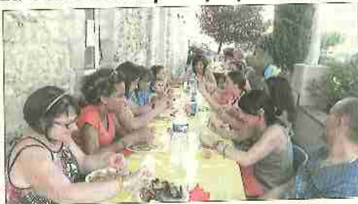
■ Tout au long de l'année, sont menées des actions pour développer ou resserrer les liens sociaux, familiaux et amicaux.