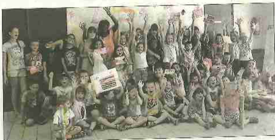
■ Les vacances au centre de loisirs ont bien commencé

Pour ce mois de juillet, les jeunes pensionnaires n'ont pas rechigné à plonger deux fois par semaine dans les eaux bleues de la piscine pour mieux supporter les fortes chaleurs et à s'installer à l'ombre des grands arbres du jardin pu-